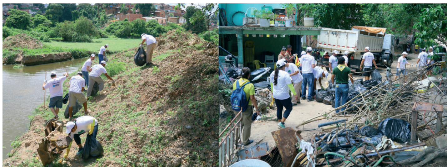
OS COLABORADORES DA EMPRESA CONTRIBUÍRAM PARA O SUCESSO DA AÇÃO SOCIAL