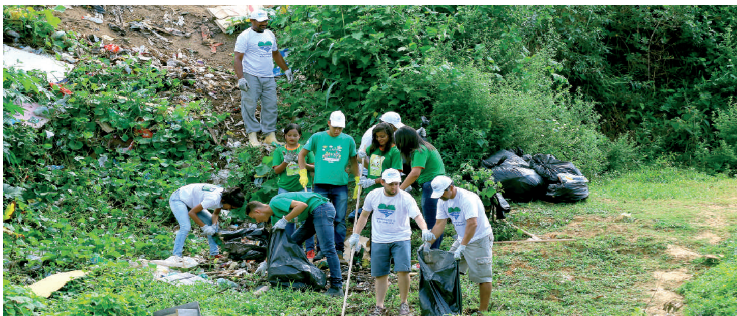
A ULTRAMEGA PROMOVEU UMA AÇÃO SOCIAL PARA A LIMPEZA DOS RIOS E CÓRREGOS DE CARAMAGIBE

riais recicláveis. O espaço da Mata Atlântica foi respeitado e há uma integração do ambiente corporativo com a natureza. É comum aparecer por ali bichos-preguiça, tamanduás e porcos espinhos. Prontamente, eles são recolhidos com todo cuidado e devolvidos à mata. Não, sem antes, despertar muita comoção e carinho dos funcionários.