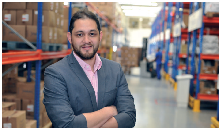
Processos automatizados que garantem eficiência.

Outro incentivador desse novo momento é a localização, que, por sua vez, é situada em um meio que não oferece risco de mudança. Assim, a firma sente-se ainda mais segura para continuar seus investimentos, pois tem um ambiente de estabilidade como base. Na verdade, esse é o outro valor organizacional: ampliar constantemente seu crescimento, sem, no entanto, tirar os pés do chão. Manter sempre sua visão institucional no horizonte, sendo norteadora de decisões e desafios, mas nunca esquecer a missão principal, a razão de sua existência, que é servir com eficiência e respeito aos clientes, fornecedores e colaboradores.